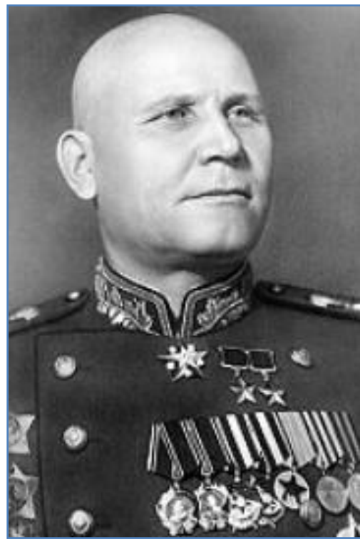
brigádní generál Ludvík Svoboda